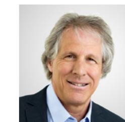
Gilles Labre Boutique Courir